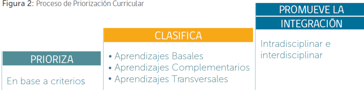
Figura 2: Proceso de Priorización Curricular