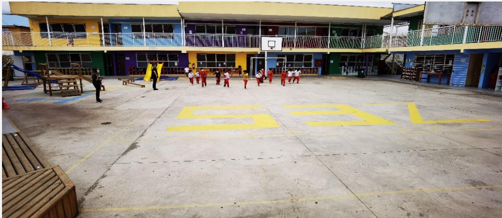
Imagen 3: Vista interior Colegio Rukalaf