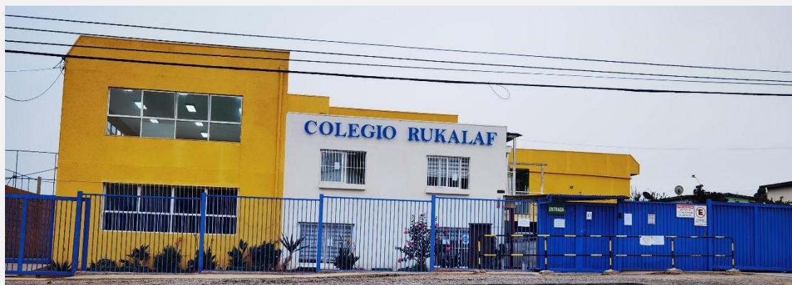
Imagen 2: Vista frontal Colegio Rukalaf.