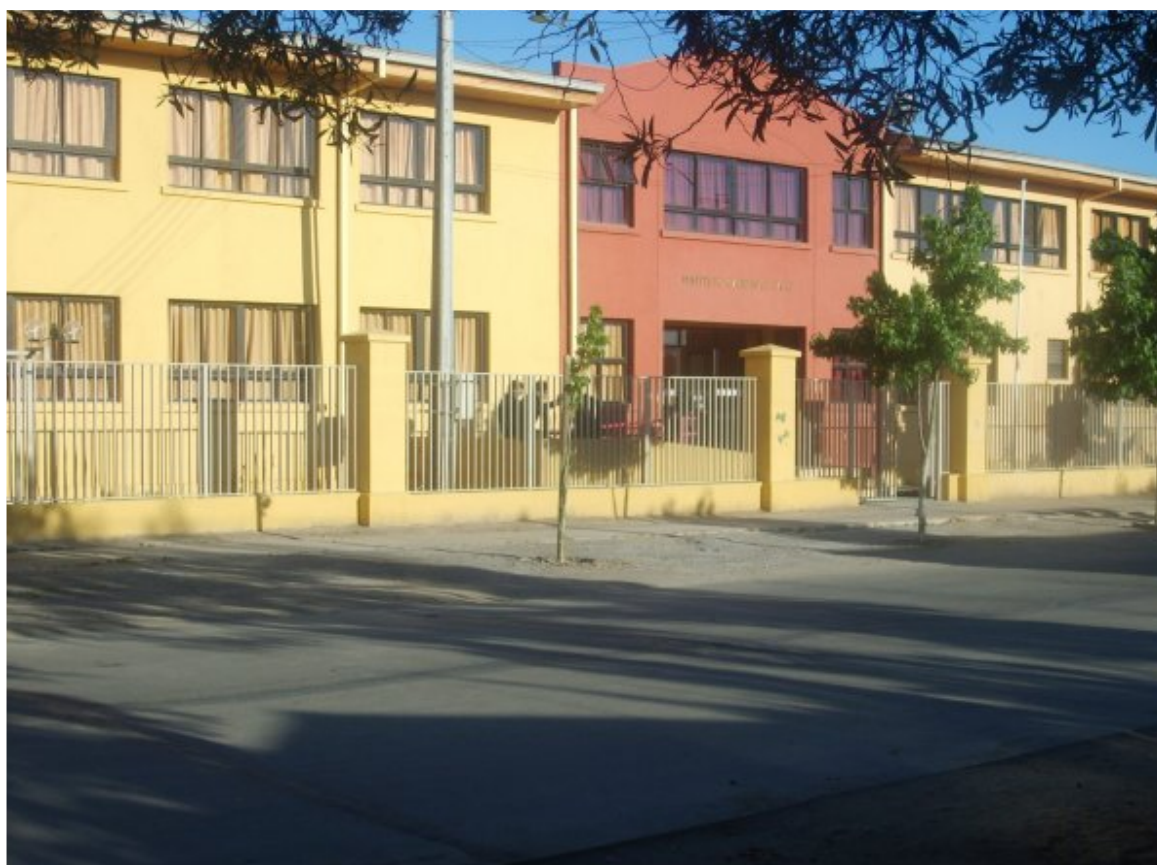
FOTO FRONTIS DE ESTABLECIMIENTO