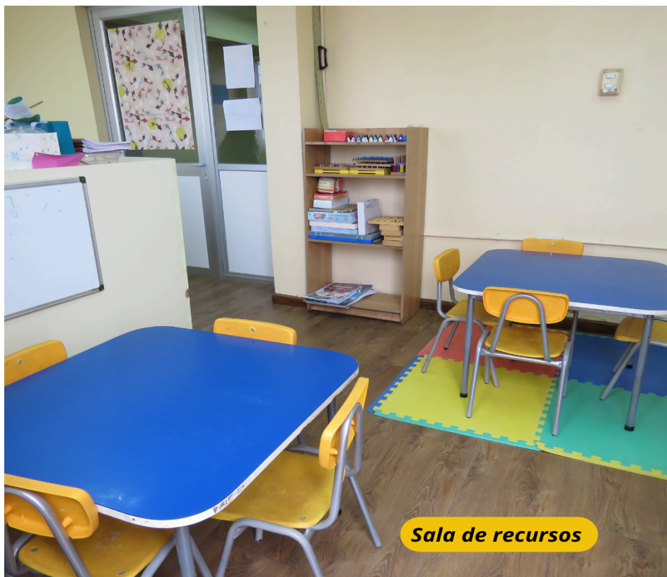
Sala de recursos