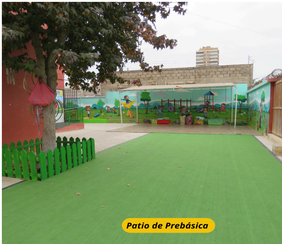
Patio de Prebásica