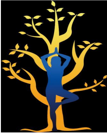
Fig. 1: El árbol.