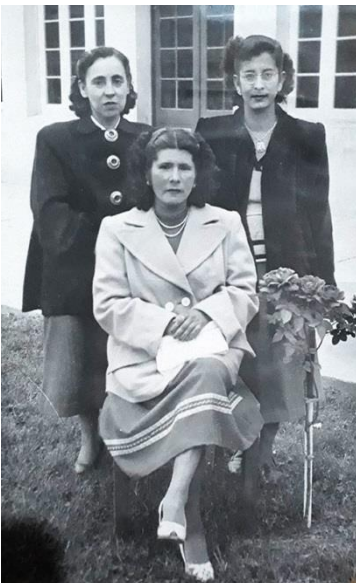
Equipo Docente 1951