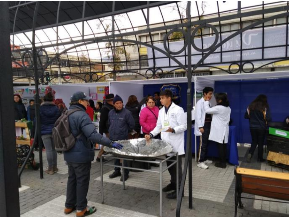
Presentación Feria de Ciencias, Plaza de Puente Alto.