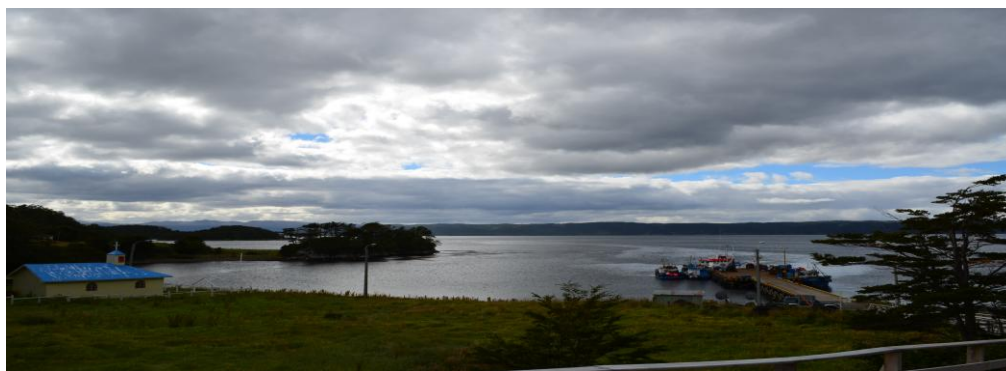
Puerto Toro fotografía APG.

Los principales tipos forestales presentes naturalmente en los bosques de la comuna son: Lengua-Coigüe de Magallanes y Coigüe de Magallanes. Estos bosques comprenden una importante superficie de bosques de protección.